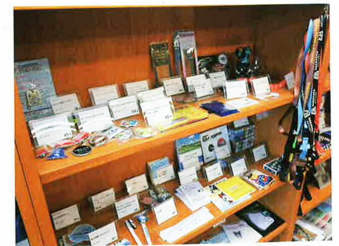
▲一流企業のノベルティグッズだけでなく、有名アーティストのツアー限定グッズなども手がける。

貿易は5000年前からある営み。形を変えて1000年後も続くでしょう。弊社は今後、取引先や扱う商品の幅をさらに広げ、売上高を現在の20億円から100億円に伸ばしたい。そして貿易の可能性を広げるため日々邁進していくつもりです。